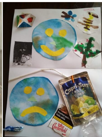
Co do přírody (ne)patří